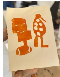
Ateliers de création lors de la Semaine des arts